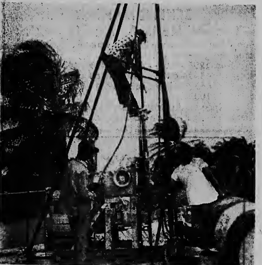
E prome boormentu no tabata mucho hundo; solamente te cinco pia, y aki nos por mira con e prome tubo di boor a worde hinka aden. E speranza ta cu lo topa cu baranca na un profundidad di mas o menos diez cinco pia. Con hundo nan lo bora ainda mas despues di esei lo depende completamente di e construccion di e fondo di baranca.